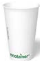
écotainer Carte Blanc®