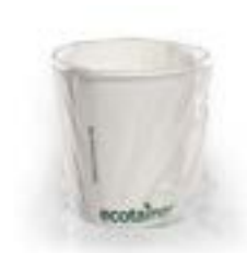
écotainer Carte Blanc®